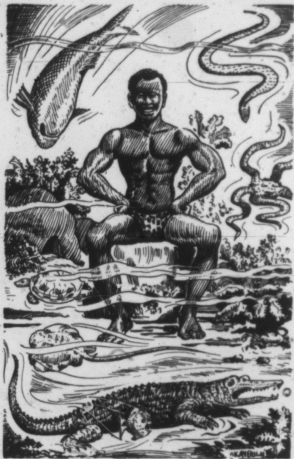
Orògodogànyin Di Èrùjèjè Ninu Ibú-Olókun